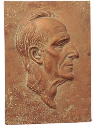
Edgardo Ubaldo Genta Bronce Diputación de Palencia