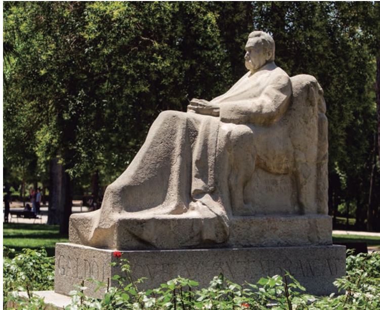
Monumento a Benito Pérez Galdós. Parque del Retiro (Madrid).

Sin olvidar tampoco su producción en el resto de España como el Monumento Funerario a Marcelino Menéndez Pelayo en la Catedral de Santander, el Monumento a Sebastián Elcano de Guetaria o el conocido Cristo del Otero , que levantó en 1927 en su Palencia natal, en realidad un Corazón de Jesús, que bendice a la ciudad desde el cerro, o su último monumento, el que levantó en la Plaza Mayor al escultor Alonso Berruguete, tan admirado por él.