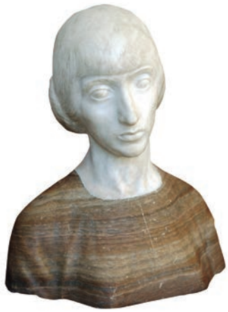
Busto de mujer Mármol blanco y alabastro de color Diputación de Palencia