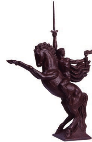
Grupo ecuestre. Boceto para el Monumento a Bolívar Yeso Diputación de Palencia