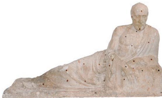
Boceto del Monumento a Ramón y Cajal. Yeso. Ayuntamiento de Palencia

Del 29 de noviembre de 2016 al 29 de enero de 2017