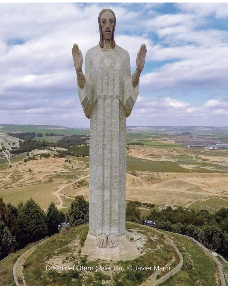
Cristo del Otero (Palencia).

En su casa taller de Toledo, Roca Tarpeya, conservaba dibujos, bocetos, estudios, y réplicas de algunas de sus obras. Muchas de ellas forman parte del Museo de Victorio Macho en Toledo, y en el Centro de Interpretación de su obra en Palencia se conservan también otras, junto a los materiales preparatorios para la realización de las obras palentinas. Parte de toda esta producción puede verse también en esta exposición como muestra del proceso creativo del escultor.