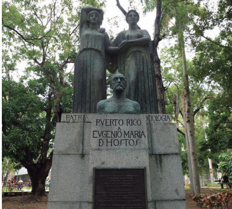
Monumento a Eugenio María de Hostos.